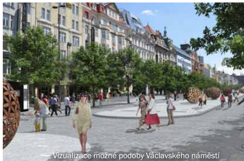
Vizualizace možné podoby Václavského náměstí

li pouze zařídit nezbytné a utéct. Aby byl prostor co nejlépe dostupný, součástí Václavského náměstí by měla být i auta. Ta by však měla jezdit pouze v úzkých koridorech a parkovat pod zemí.