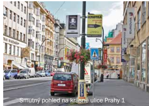
Smutný pohled na krásné ulice Prahy 1

Všudypřítomné venkovní reklamy si musel všimnout každý obyvatel Prahy 1, pokud tedy již pod tíhou permanentního vizuálního tlaku raději nerezignoval a nesklopil oči k chodníku. Nevzdávejme to. Příklady ze západní Evropy motivují a dávají naději. Ještě jako radní Prahy 1 jsem inicioval audit venkovní reklamy na území Prahy 1. Ten ukázal dvě podstatné věci. Tou první je fakt, že drtivá většina venkovní reklamy je v centru umístěna nelegálně, potřebná povolení téměř nikdo nemá a dokonce o ně často ani nežádal. Podnikatelé spoléhají na to, že úřady nestíhají ani kontrolovat, natož trestat. Druhá důležitá zpráva je, že současný nechutný stav není neměnný. Městská část má nástroje na to, jak s nelegální a nevkusnou venkovní reklamou účinně bojovat. Pokud bychom získali důvěru voličů, pustil bych se do toho se vsí vervou. Abychom si rozuměli, nechci podnikatelům brát právo na propagaci. Víím, že bez ní by řada z nich třeba i zkrachovala. Ale jsem přesvědčen, že reklama by v tak unikátní lokalitě, jakou je centrum Prahy, měla splňovat určitá estetická kritéria.