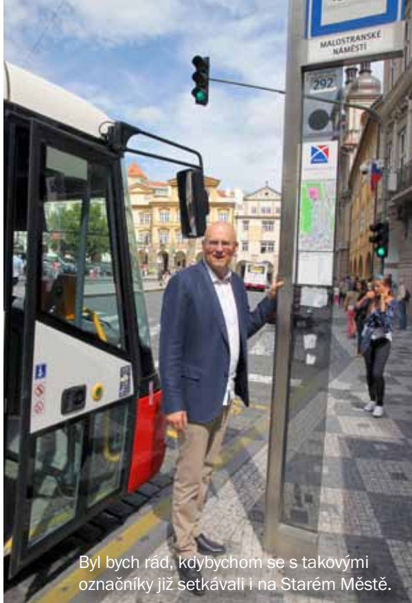
Byl bych rád, kdybychom se s takovými označníky již setkávali i na Starém Městě.