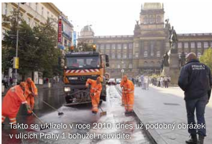
Takto se uklízelo v roce 2010, dnes už podobný obrázek v ulicích Prahy 1 bohužel neuvídíte.

Po dobu mého starostování Praze 1 byl úklid ulic jednou z absolutních priorit. Moji nepřátelé sice šířili hanlivou přezdívku pan Košťátko, ale já trvám na tom, že platilo a platí: Nejprve má být uklizeno před vlastním prahem!